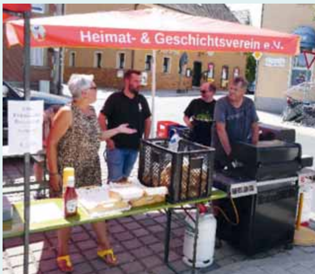
Die Bratwurstversorgung steht.

Dieser Sonntag war in vielerlei Hinsicht ein denkwürdiger Tag für Veitsbronn, denn der wunderbar sanierte Dorfplatz wurde eingeweiht und der VHGV durfte für Bratwurst und Getränke sorgen. Dafür haben sich die Verantwortlichen ausgerechnet den heißesten Tag des