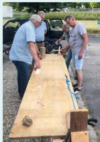
Männer bei der Arbeit