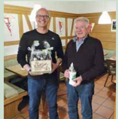
Ehrung für 65 Jahre Mitgliedschaft