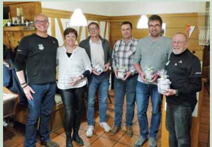
Ehrung für 40 Jahre Mitgliedschaft