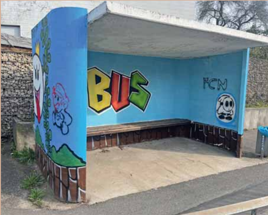
Im Stile der bekannten Videospierreihe „Super Mario“ gestalteten die Kinder und Jugendlichen erst kürzlich eine Bushaltestelle.

und ausgeprägten Wünschen eben doch nicht dazu kommt, dass Träume in Erfüllung gehen.“