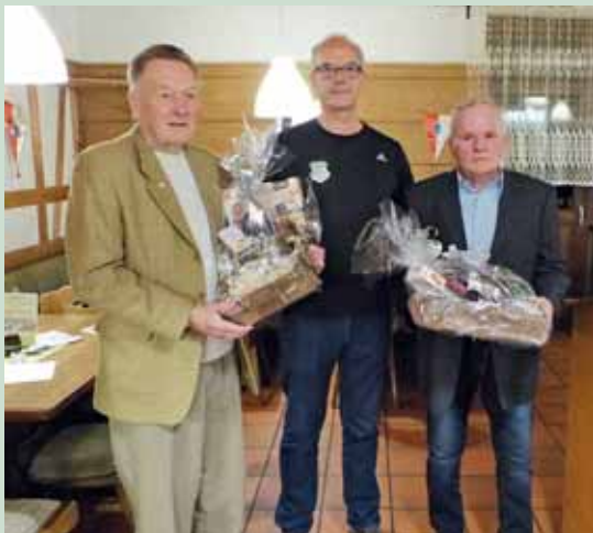
Ehrung für 70 Jahre Mitgliedschaft