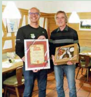
Ehrung für 60 Jahre Mitgliedschaft