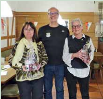
Ehrung für 50 Jahre Mitgliedschaft